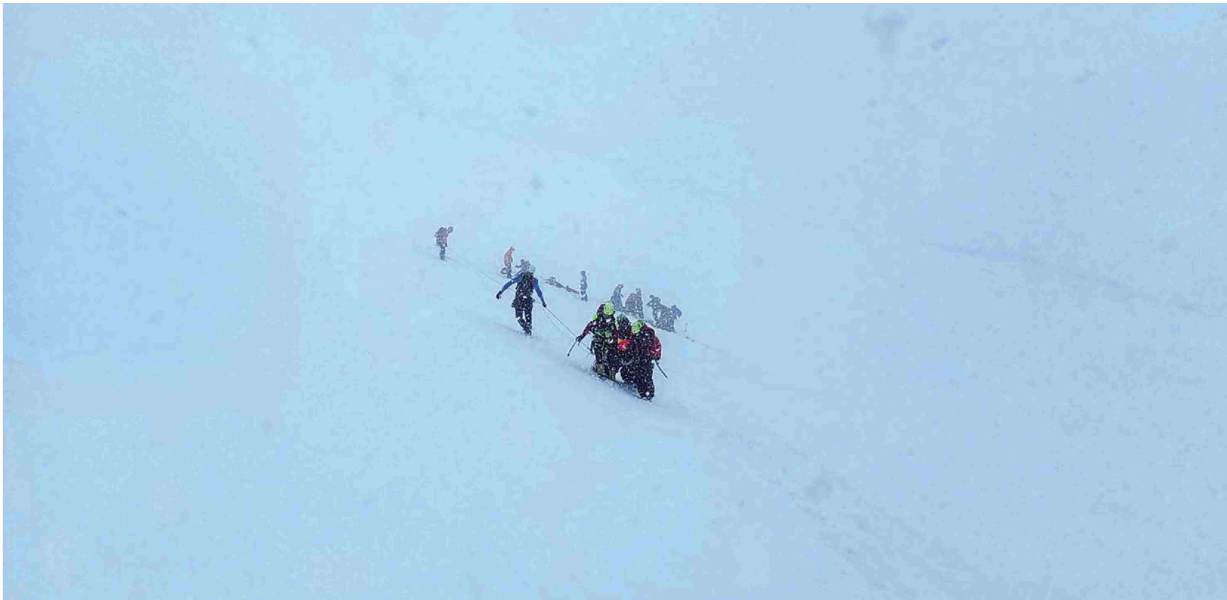
Gorska nesreča na Mali Mojstrovki je pokazala na povsem neurejeno in neregulirano stanje gorskega vodništva.